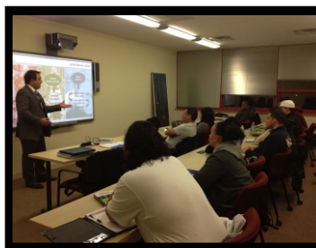
NJCU, aula sobre “Grandes Eventos”.